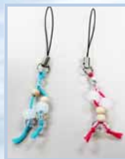
シュボシュボ君 UVビーズストラップ