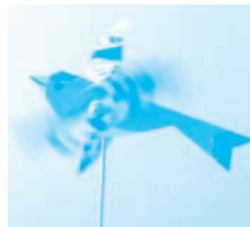
▲小鳥のかざぐるま