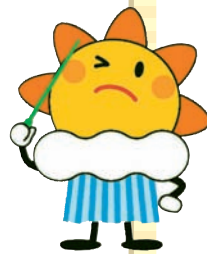
気象庁マスコット キャラクター “はれるん”