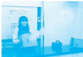
▲「びっくり実験大集合!」のようす

●21日(土)～25日(水) (休館日を除く) ▲「びっくり実験大集合!」のようす ※期間中の(土)(日)は、11:00～11:30にも おこないます。